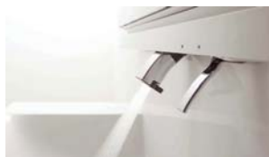
よく使う正面のハンドルで「水」を出す省エネ設計です。